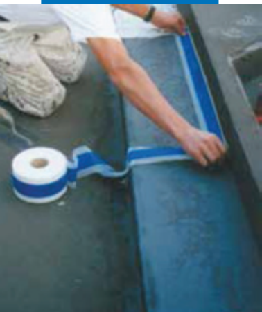
Пример гидроизоляции угла между нижней и боковой частью ванны с помощью Mapeband

Mapelastic AquaDefence и разгладьте с помощью гладкого шпателя.