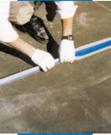
Пример гидроизоляции деформационного шва на террасе