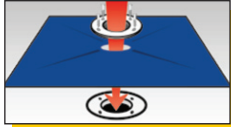
Установка прокладки для эластичной гидроизоляции и герметизации дренажных отверстий (400x400 мм)