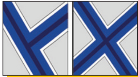
Установка T-образных профилей