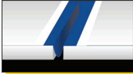
Расположение Mapeband в форме буквы Ω в деформационном шве